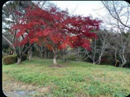
オートサイト② “ちょい狭”