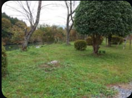
オートサイト① “ソコ用”